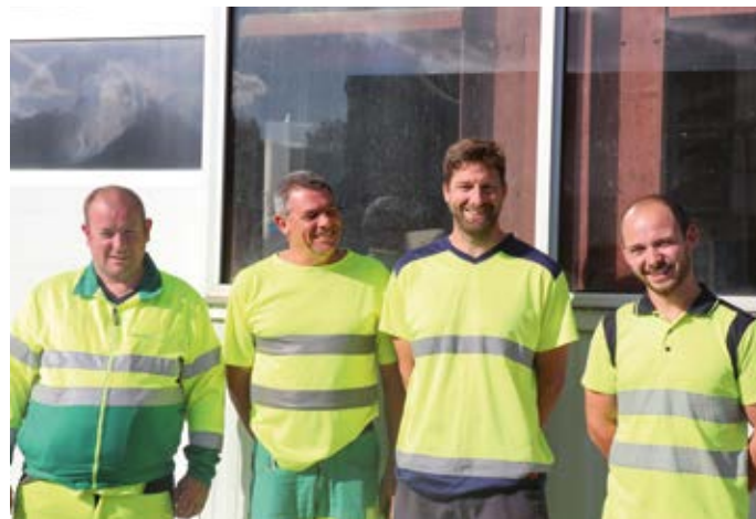
Service Espaces Verts.