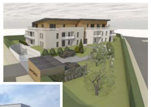
Un projet de 17 logements locatifs sociaux en cours d'étude porté par Lorient Habitat.

Des aménagements spécifiques liés à l'intégration du ruisseau situé aux abords de l'avenue Simone Veil restent à étudier, en lien avec le département (secteur de la sortie du futur échangeur de Kergoal).