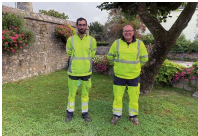
Service Propreté Urbaine.