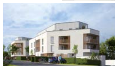
Le Clos Luna, une résidence privée de 38 logements portée par le groupe Harvey.