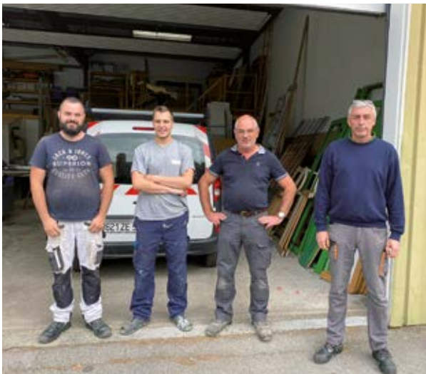
Service des Batiments Communaux.