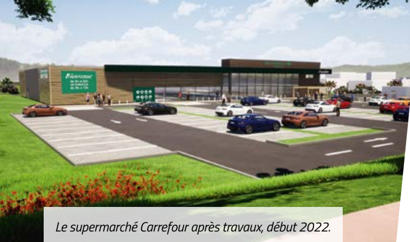
Le supermarché Carrefour après travaux, début 2022.