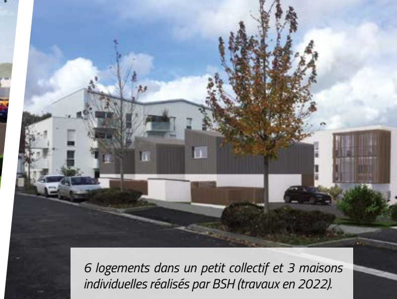
6 logements dans un petit collectif et 3 maisons individuelles réalisés par BSH (travaux en 2022).